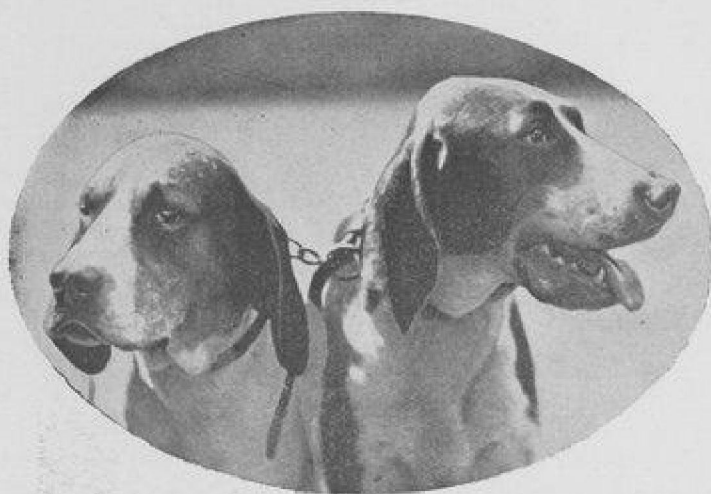
BACHANAL ET DANEMARK.