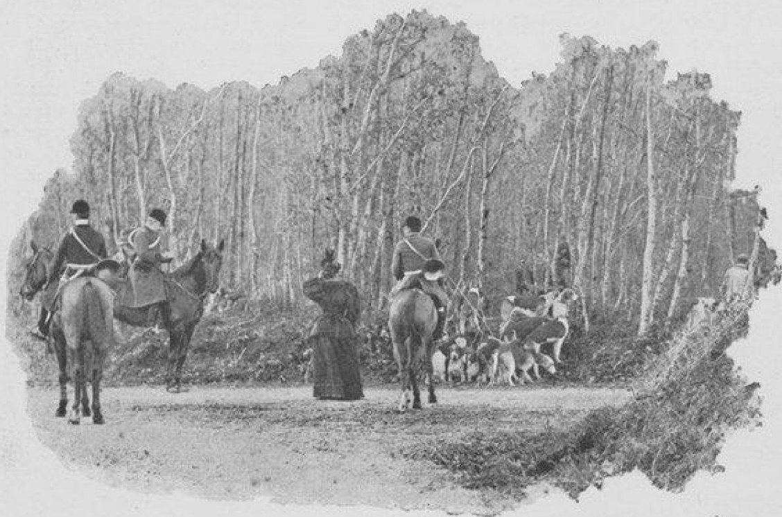
L'ATTENTE DU LANCER.

Le nombre de yearlings vendus en vente publique est légèrement inférieur à celui de 1894 (288 contre 293), mais les prix d'achat ont été considérablement supérieurs. La moyenne des prix atteints par les yearlings aux ventes de Paris, cette année, est de 2,950 francs, tandis qu'en 1894 cette moyenne n'était que de 1,550 francs. Aux ventes effectuées à Deauville, le prix moyen s'est élevé de 3,550 francs en 1894, à 5,450 francs cette année.