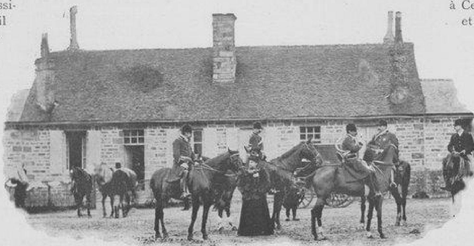
LA MAISON FORESTIÈRE.

Les prises de l'équipage qui, l'an prochain atteindront la 500 e , sont inscrites sur un ravissant livre tout illustré par le peintre La Rocque, le plus peintre des veneurs et le plus veneur des peintres, et les gais diners de la Saint-Hubert à Vaubadon, présidés par un grand cerf en